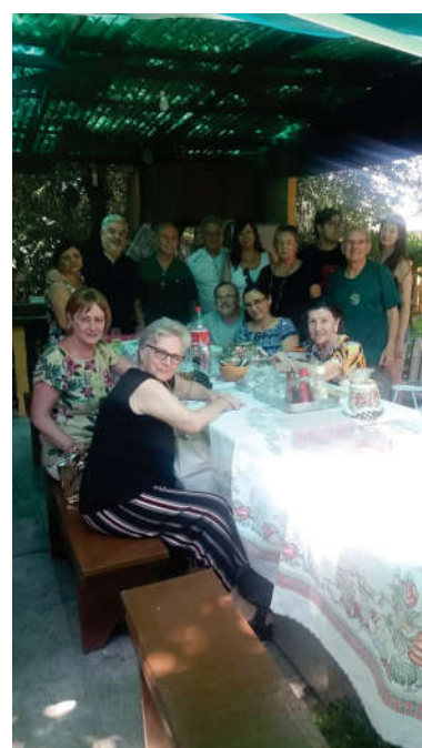
Tradicional festa de fim de ano da diretoria da UBT Porto Alegre, na casa do presidente, Data 16/12/2018 - parte dos integrantes

VOCÊ JÁ VISITOU O NOVO SITE DA UBT PORTO ALEGRE? www.ubtportoalegre.wordpress.com